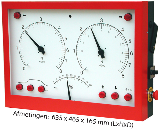
Afmetingen: 635 x 465 x 165 mm (LxHxD)